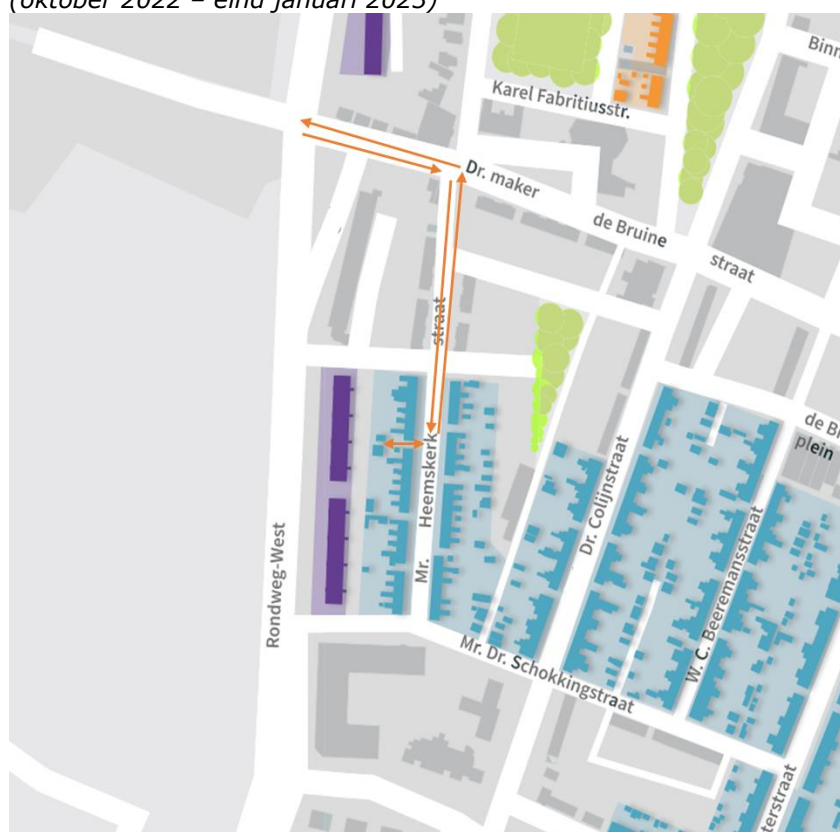
Plattegrond route sloopverkeer Mr. Heemskerkstraat 26-64 (oktober 2022 – eind januari 2023)